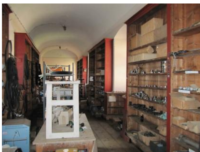
Widok współczesny pomieszczeń skrzydła „A” byłej biblioteki Schaffgotschów w Cieplicach.