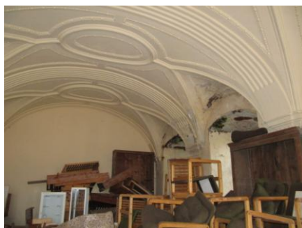
Widok współczesny pomieszczeń skrzydła „C” byłej biblioteki Schaffgotschów w Cieplicach.