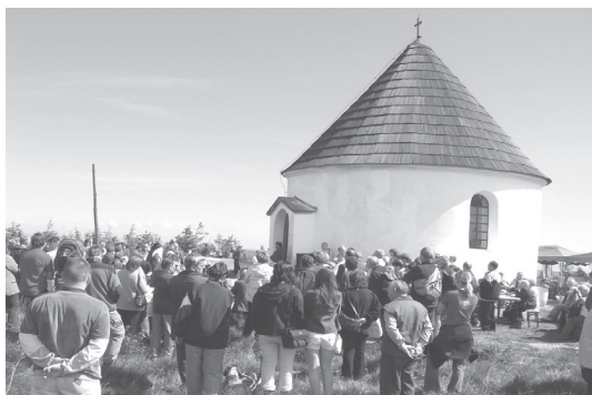
Fot. 2. Kunštátská kaple v roce 2004.