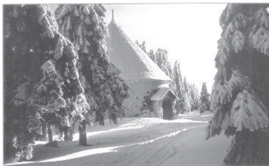
Fot. 1. Kunštátská kaple ve dvacátých letech 20. století. (Pohlednice z r. 1930, soukromý archiv ing. Jiřího Slavíka)