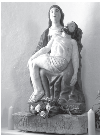
Fot. 3. Pieta z Kunštátské kaple (dnes ve zdobnickém kostele).